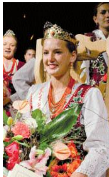
Tegoroczna miss Podhala.

Od początku lipca rozgrzewają całe Podhale. Zarówno dla miejscowych, jak i dla turystów są okazją do radosnej zabawy, obcowania z lokalnym folklorem, sprawdzenia się w konkursach i biesiady pod gołym niebem do późnych godzin wieczornych. Tatrzańskie Wici – unikalny cykl góralskich imprez trwa aż do połowy września.