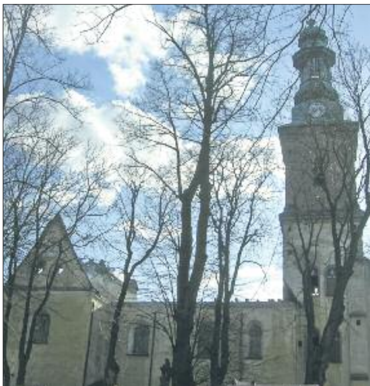
Klasztor w Alwerni po pożarze.

Informacje na temat klasztoru dostępne są na stronie internetowej klasztoru www.bernardyni-alwernia.pl .